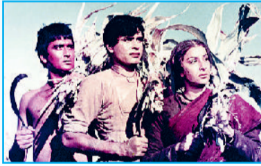
'मदर इंडिया' में दिखा वास्तविक ग्राम्य जीवन