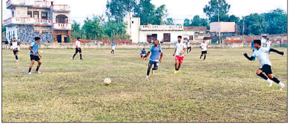
बहादुरगढ़। गोल के लिए फुटबॉल की ओर भागते खिलाड़ी।

मेहंदीपुर डाबोदा में आयोजित पंचायती फुटबॉल प्रतियोगिता में शनिवार को कई रोमांचक मुकाबले खेले गए। अब रविवार को सेमीफाइनल व फाइनल मुकाबले खेले जाएंगे। विजेता टीम को 51 हजार रुपये का पुरस्कार दिया जाएगा। गत 23 अक्टूबर को यह पंचायती फुटबॉल प्रतियोगिता डाबोदा के सरकारी स्कूल के मैदान में शुरू हुई थी। हरियाणा, दिल्ली व राजस्थान की 35 टीमों ने भाग लिया। शनिवार को भी कई रोमांचक मुकाबले हुए। मैडी क्लब डाबोदा ने गंगावा हिसार की टीम को पेनल्टी शूट में 4-3 के