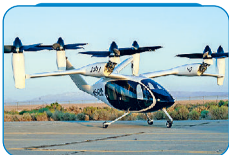
जॉबी एविएशन, अमेरिका की ईवीटीओल

चुका है। कई कंपनियां एयर टैक्सि शुरू करने की बिल्कुल व्यावहारिक योजनाएं बना चुकी हैं, तो कुछ देशों ने सर्टिफिकेशन की प्रक्रिया भी शुरू कर दी है। कहने का मतलब उड़न कारें