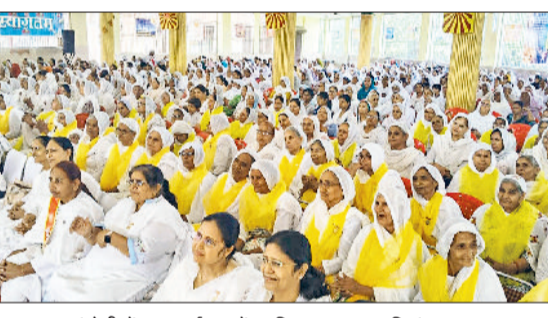
बहादुरगढ़। मांडोटी में हुए कार्यक्रम में उपस्थित ब्रह्माकुमारियां।