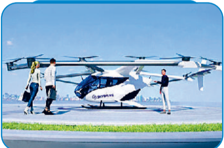
स्काई ड्राइव, जापान की एयरटेक्स

कई स्तरों पर हो रही तैयारी: साल 2025 के अंत तक दुनिया भर में कई कंपनियां ऐसी