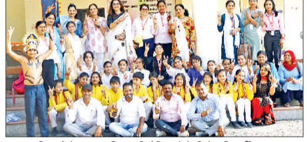
झज्जर। शिक्षकों के साथ उपस्थित प्रतियोगिताओं के विजेता विद्यार्थी।