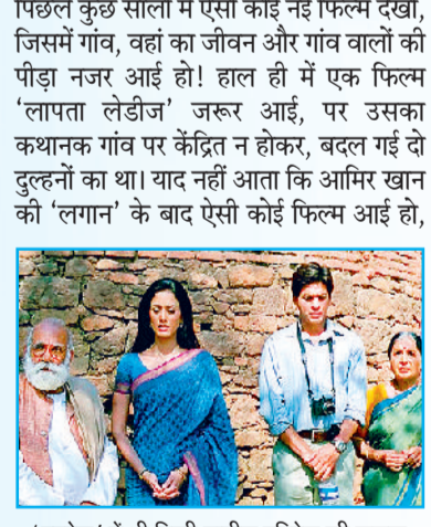
'स्वदेश' में भी दिखी ग्रामीण परिवेश की झलक

हाल के वर्षों में आई हिंदी फिल्मों की बात करें तो उसमें गांव और ग्रामीण परिवेश की कहानियां बिल्कुल गायब रही हैं या न के बराबर ही नजर आई हैं। कथानकों से गांव विलुप्त होने का मतलब है, देश की 60% आबादी सिनेमा से गायब हो गई। अब जो फिल्में बनाई जा रही हैं, उनकी कहानियां 40% शहरी आबादी पर केंद्रित रहती हैं। इस सच्चाई को भी नकारा नहीं जा सकता कि गांव के जीवन की कहानियों से हिंदी सिनेमा का बॉक्स ऑफिस समृद्ध नहीं हो सकता। लेकिन समानांतर सिनेमा का तो मूल आधार ही ग्रामीण पृष्ठभूमि होती है, उसे ही इन कहानियों का प्रतिबिंब कहा जाता है। 'अंकुर', 'पार', 'दो बीघा जमीन', 'सूरज का सातवां घोड़ा' और 'अंतर्नाम' जैसी फिल्में ग्रामीण भारत का प्रतिनिधित्व करने में सफल रही। लेकिन अब ऐसी फिल्में भी नहीं बनती हैं। गांवों से दूर हो रही फिल्में: याद कीजिए कि पिछले कुछ सालों में ऐसी कोई नई फिल्म देखी, जिसमें गांव, वहां का जीवन और गांव वालों की पीड़ा नजर आई हो! हाल ही में एक फिल्म 'लापता लीडोज' जरूर आई, पर उसका कथानक गांव पर केंद्रित न होकर, बदल गई दो दुल्हनियों का था। याद नहीं आता कि आम्बि खान की 'लगान' के बाद ऐसी कोई फिल्म आई हो,