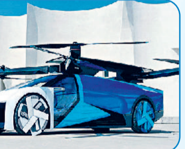
एक्सपेन एयरोहॉट ईवीटीओल, चीन

जमीन में जरूरत पड़ने पर चलने वाली ये कारें परीक्षण और अपग्रेडेशन की प्रक्रिया से गुजर रही हैं। इन दिनों इसी काल्पनिक सच को हकीकत में बदलने के लिए विकसित देशों में दर्जनों उड़न कारें अपनी बुनियादी उड़ान भर रही हैं या दूसरे शब्दों में टैड हो रही हैं। ऐसे आई सुरक्षियों में: पलाइंग कारों की चर्चा अचानक इसलिए बढ़ी है, क्योंकि पिछले दिनों दो उड़ने वाली कारें एक फ्लाइंग शो के दौरान हवा में ही टकरा गईं और एक बड़ा हादसा हो गया। यह अलग बात है कि इसमें कोई जनहानि नहीं हुई। दरअसल, चीन के जिलिन में बीते 16 सितंबर 2025 की दोपहर को चल रहे चांगचुन एयर शो के दौरान एक्सपेन एयरोहॉट की दो वीटीओएल आपस में टकराकर दुर्घटनाग्रस्त हो गईं। इस टक्कर से एक यात्री घायल हो गया, जिसे जानलेवा चोट नहीं लगी। लेकिन इस दुर्घटना की वजह से रातों-रात पूरी दुनिया की आटोमोबाइल इंडस्ट्री में वीटीओएल कारों के