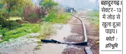
बहादुरगढ़। सेक्टर-13 में जोड़ से खुला हुआ पाइप।

चरक औषधीय पार्क में बीती रात को फिर से जलभराव की समस्या गहरा गई। निकासी के लिए लगाए गए पाइप खुलने के चलते यह स म र या उत्पन्न हुई। हा लां कि पानी निकालने का काम अभी जारी है। दरअसल, सेक्टर-13 की ग्रीन बेल्ट में बनाए गए चरक पार्क में बरसात तथा निकासी नाला टूटा होने के कारण पानी भर गया था। जलभराव के कारण इस पार्क के हजारों पौधे नष्ट हो गए।