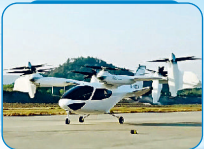
टीकेब कंपनी चीन की ई20 एयरटेक्स

किरसे पूरी तरह से छा गए और हर किसी को पता लग गया कि उड़ने वाली कारों अब विज्ञान कथा भर नहीं हैं, वास्तविक जिंदगी का हिस्सा बनने की कगार पर हैं। निकट भविष्य में इनका उपयोग शहरी परिवहन, आपातकालीन सेवाओं और पर्यटन जैसे क्षेत्रों में बहुत कामन हो जाएगा।