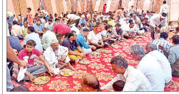
झज्जर। चौगान माता के भंडारे में प्रसाद ग्रहण करते श्रद्धालु।