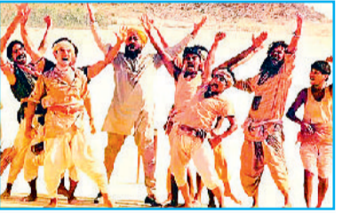
ग्रामीण परिवेश पर बनी हिट फिल्म 'लगान'

फिल्म आई, पर इसमें भी गांव मूल रूप में नहीं दिखा। कुछ साल पहले 'पीपली लाइव' आई थी, जो गांव की सच्चाई और समस्याओं वाली फिल्म थी। इसमें किसानों के लिए बनी योजनाओं को बाबुओं और अफसरों द्वारा हड़पने का जिक्र ज्यादा था। लेकिन बड़े तबके को यह फिल्म समझ में ही नहीं आई सो आर्थिक रूप से फायदेमंद नहीं रही। ग्रामीण फिल्मों का था सुनहरा दौर: सिनेमा का एक दौर ऐसा भी आया था, जब गांव और गांव वाले ही सिनेमा की पहचान हुआ करते थे। लेकिन जैसे-जैसे सिनेमा का बाजार बढ़ा, परदे से गांव गायब होते गए। फिल्मों का इतिहास टटोला जाए, तो शुरुआती फिल्मों का कथानक गांव की पगडंडियों से होकर ही गुजरता। बी. शांताराम की 'दो बीघा जमीन', विमल रॉय की 'बादगा' और 'बंदिनी', राज कपूर की 'आवारा', 'श्री 420' और 'बूट पॉलिश' ग्रामीण परिवेश की ऐसी फिल्में थीं, जिन्होंने देश और दुनिया को वहां की समस्याओं और उनके जीवन से रूबरू करवाया था। गांव के जीवन पर बनीं इन फिल्मों में एक अलग सी महक होती थी। धीरे-धीरे दूर हो गई गांव की महक: सिनेमा के परदे से गांव की मिट्टी की सौंधी महक ही नहीं, लोकगीत भी गायब हो गए। यह दौर एक दो सालों में नहीं आया। 80 के दशक के बाद से ही फिल्मकारों ने धीरे-धीरे गांवों की धूलभरी पगडंडी को छोड़ दिया था। फिल्मों में खेत-खलिहान, लहलहाती फसलें, हल चलाते किसान, खेत जोतते ट्रैक्टर, गांव की चौपाल और वहां की पंचायतें गायब हैं। ओटीटी प्लेटफॉर्म की कुछ वेब सीरीजों में गांव जरूर दिखाई दिए पर उनका फोकस अपराध और अपराधियों पर फोकस होता है। वास्तव में गांव की कहानियों और किसानों