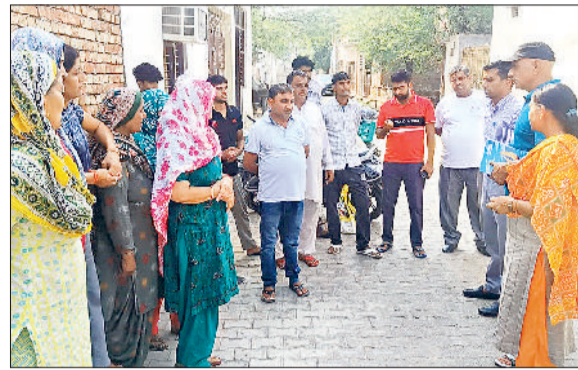
झज्जर। ग्रामीणों को नशे के दुष्परिणाम के प्रति जागरूक करते पुलिस टीम तथा डॉक्यूमेंट्री फिल्म देखते विद्यार्थी।