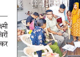
झज्जर। रुमाष नगर के शिव मंदिर में आवेदन करते हुए लाभार्थी तथा सैनी धर्मशाला में ड्यूटी पर मौजूद कर्मचारी।

सरकार द्वारा शुरू की गई लाडो लक्ष्मी योजना के अंतर्गत लगाए सहायता शिविरों में पहले दिन नाममात्र लोगों ने पहुंचकर आवेदन किया और लाभ उठाया। शहर में नौ अलग-अलग स्थानों पर लगाए गए सहायता शिविरों में कई स्थान ऐसे भी रहे जहां एक भी व्यक्ति ने पहुंच कर आवेदन नहीं किया। ऐसे में संबंधित ड्यूटी कर्मचारी हाथ पर हाथ धरे अपने स्थान पर बैठे नजर आए। एक-दो स्थानों पर आवेदनकर्ता पहुंचे भी तो उनमें दस्तावेजों की कमी के कारण आवेदन नहीं हो पाए। शहर में कुल नौ स्थानों पर लगाए